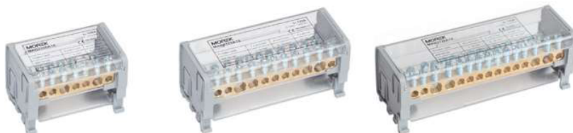
Moblock 2P 100A-7

Za jednostavnije i lakše povezivanje ulaz od 160A je na sabirnici razdvojen od izlaza. Masivni 50mm 2 završetak sabirnice ne ograničava strujni kapacitet bloka i postavljen je u ojačano plastično kućište.