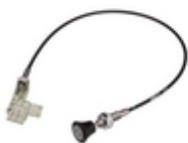
Mechanical remote control